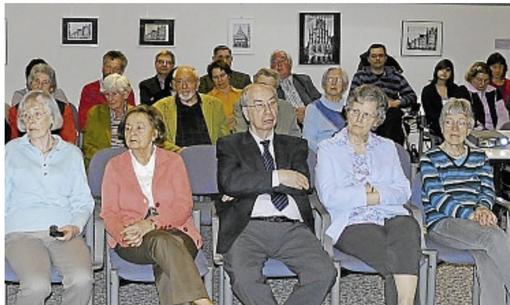
In der DKV-Residenz am Tibusplatz wurden gestern die drei ersten kundenorientierten Qualitätsberichte vorgestellt.

Die kundenorientierten Qualitätsberichte hat das Beratungsunternehmen Konkret